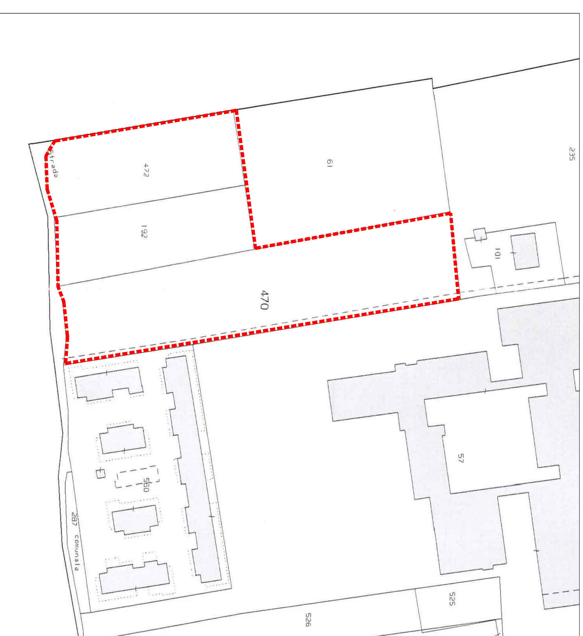
estratto mappa - Comune di Castelnuovo Veneto - foglio 39° mappele 192 mq 2.500 - mappele 470 mq 6.085 - mappele 472 mq 2.604 perimetro P.U.A. di progetto